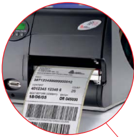
Orderpicken / verpakken